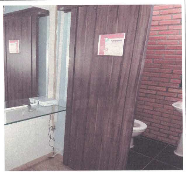
FOTO DO BANHEIRO FEMININO