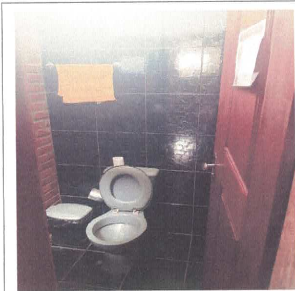
FOTO DO BANHEIRO MASCULINO