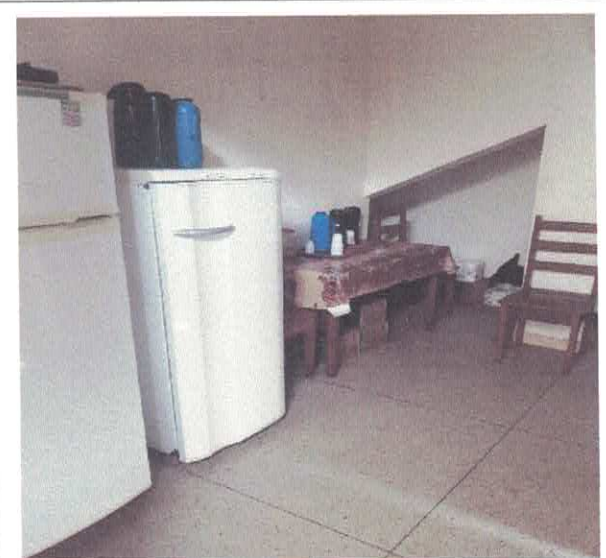
FOTO DA COZINHA