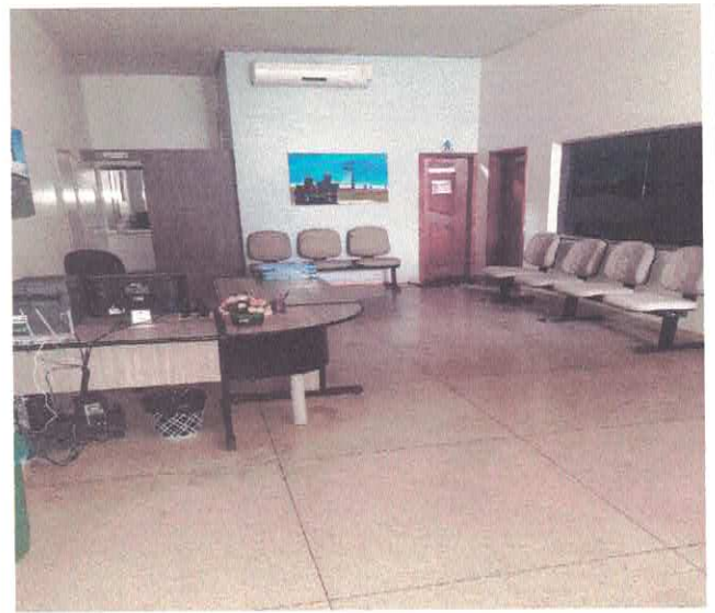
FOTO RECEPÇÃO DA SALA PRESIDENTE E VICE