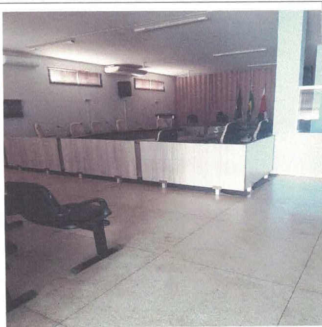
FOTO DO AUDITORIO