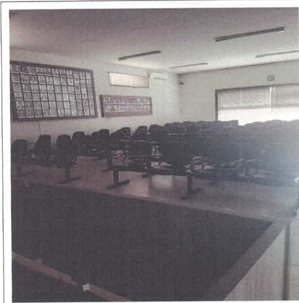
FOTO DO AUDITORIO