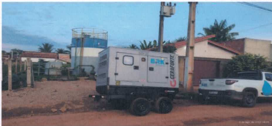
Figura 06 – Transformador de energia durante transporte para instalação