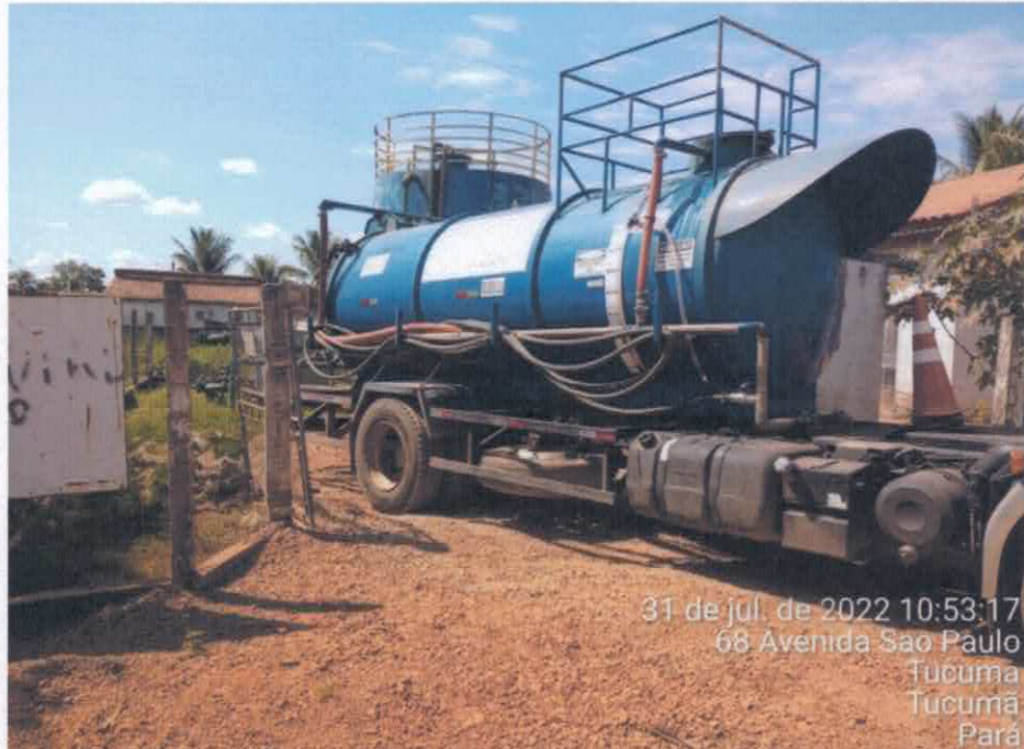
Figura 03 – Caminhão Pipa apoiando no abastecimento de água das residências

BRK Ambiental Tucumã: serviço suspenso devido reparo emergencial. Retorno as 22:00 do dia 31/07 Duvidas, ligue 0800 6440 295 , Whatsapp 11 99988 000