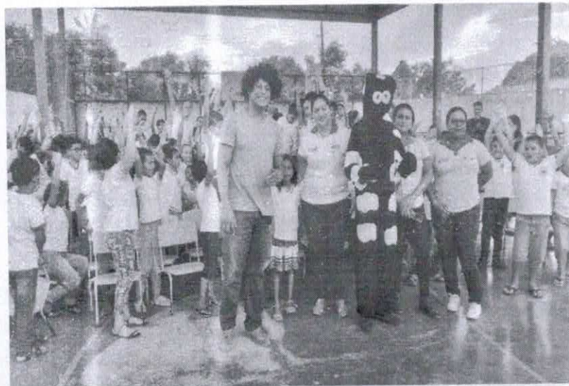
Escola Alfredo Balco - Vespertino