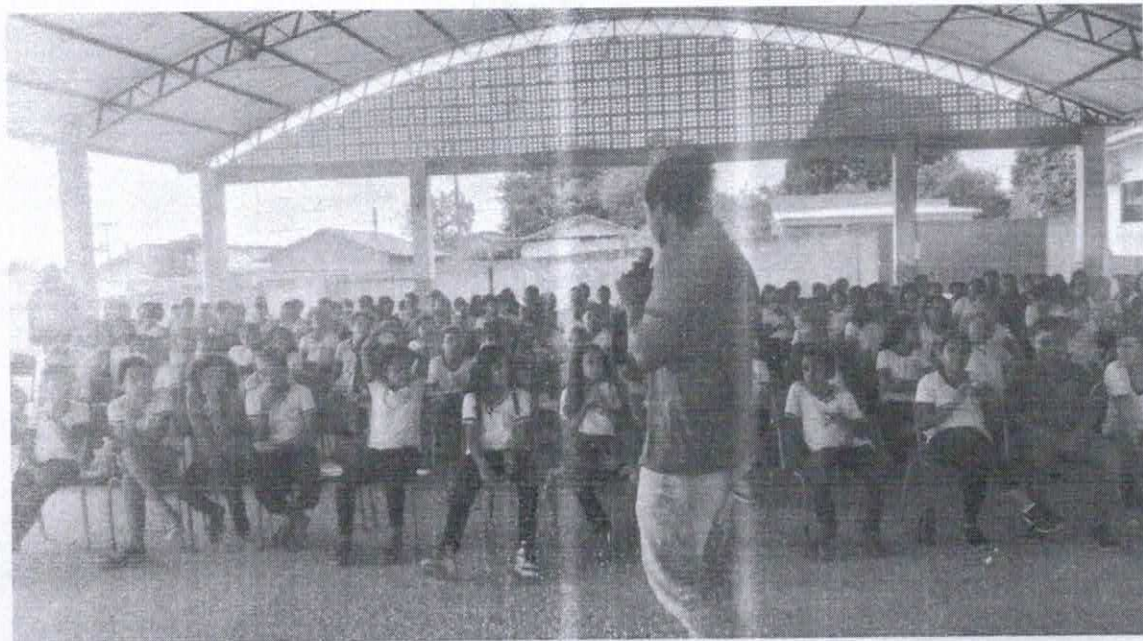
Escola Elcione Barbalho - Matutino

Professora de TUCUMÃ GENTE QUE CUIDA DA GENTE 1943 2023