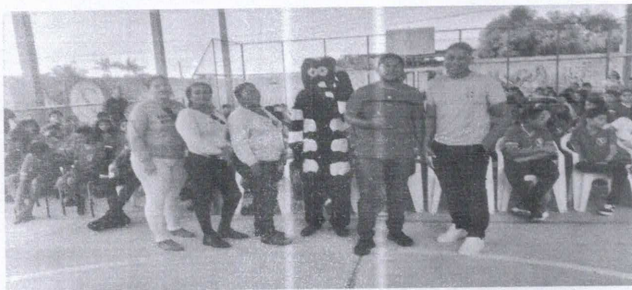
Escola Pró - Mulher - Vespertino