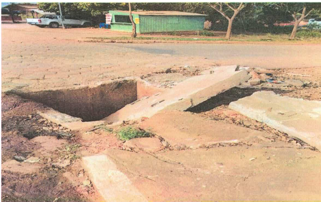
Bueiro localizado na Avenida Brasil – próximo ao Banco da Amazônia/BASA