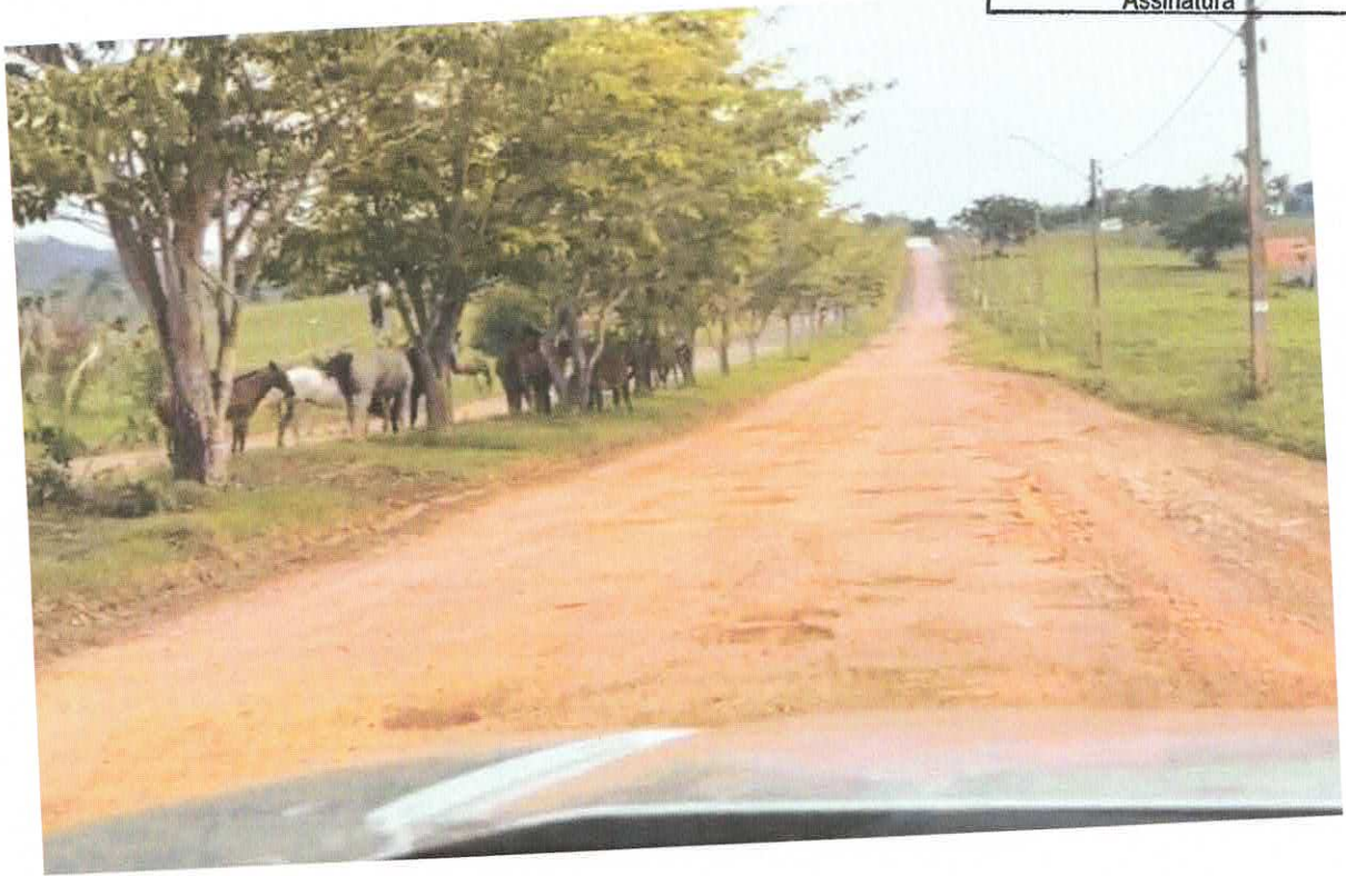
ANIMAIS SOLTOS - BAIRRO BURITI