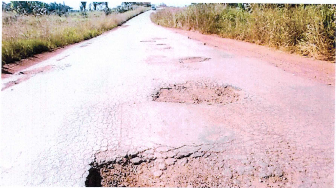
Esta é a condição da PA-279 atualmente, entre Tucumã e Vila Carapanã (Imagem: Reprodução) ( blogdojoaocarlos.com.br/pa-279-tera-pavimento-restaurado/ )